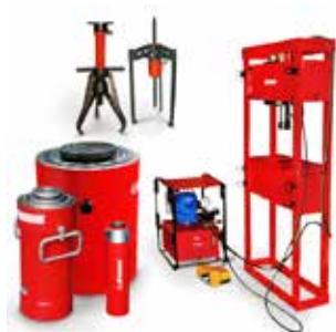
Общепромышленный гидроинструмент и оборудование