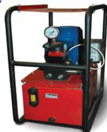
с ручным управлением

В стандартной комплектации оснащены: манометром, предохранительным клапаном, фильтром слива, термодатчиком и уровнемером, модели НЭЭ комплектуются кнопочным пультом управления.