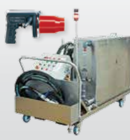
Системы очистки трубопроводов