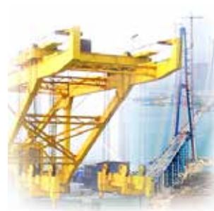
Профессиональное такелажное оборудование