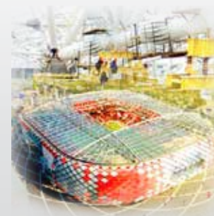
Такелажные работы. Аренда оборудования