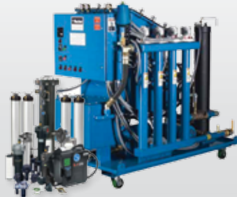
Фильтры и системы фильтрации