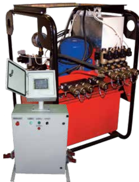
Станции систем перемещения, высокой мощности

Алгоритм управляющей программы обеспечивает тестирование системы подъема, управление перемещением объекта, как в ручном, так и в автоматическом режимах при совместной синхронной или раздельной работе исполнительных механизмов, горизонтирование объекта в двух осях в процессе перемещения с заданной точностью (до 0,05°).