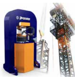
Оборудование для производства строп