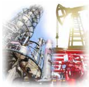
Гидрооборудование для нефтегазовой отрасли