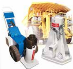
Гидрооборудование для горной промышленности