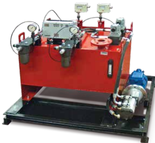
Станции смазки и заправки маслом