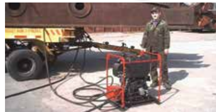
Резервное и групповое гидроснабжение