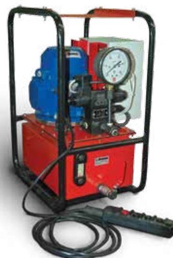
с электромагнитным управлением