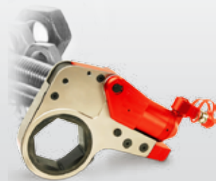
Гидроинструмент для резьбовых соединений