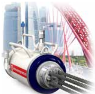
Гидрооборудование для строительной отрасли