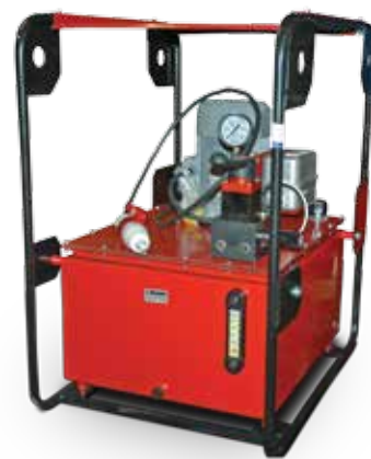
с ручным управлением