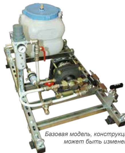
Базовая модель, конструкция может быть изменена

Отрасли промышленности: нефтегазовая, нефтехимическая, автомобильная, бумажная, пищевая, оборонная, аэрокосмическая, электроэнергетика, судостроение.