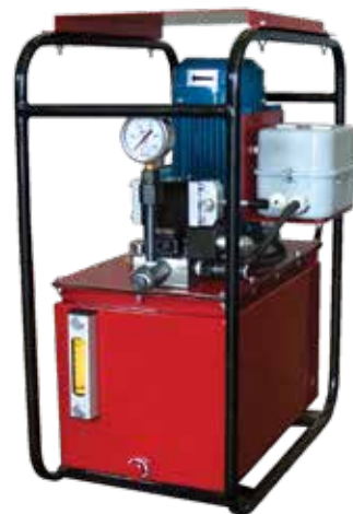
с электромагнитным управлением